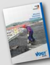
Bitumen Flachdach Abdichtungen