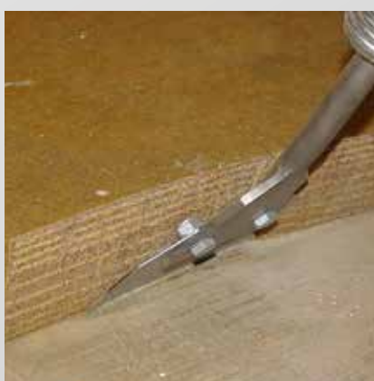
Entfernen von Teppich