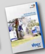
Bodenbelüftungs- und Injektionstechnik

VOGT Baugeräte GmbH Industriestraße 39 D-95466 Weidenberg