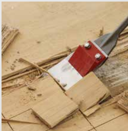
Verklebtes Parkett ausbauen