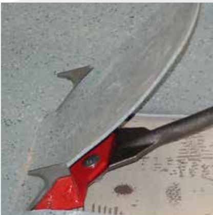
Weiche Beläge lösen