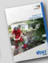
Garten- und Landschaftsbau