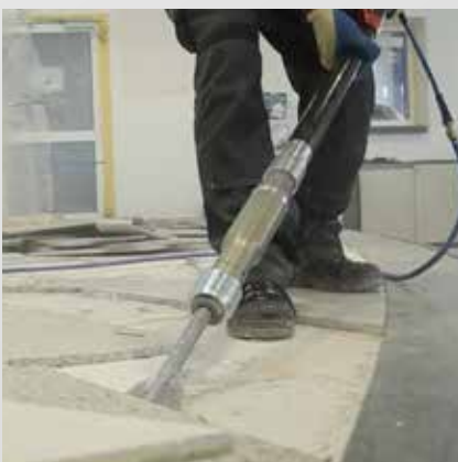
Lösen von Bodenfliesen