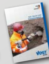
Tief-, Kanal- und Rohrleitungsbau